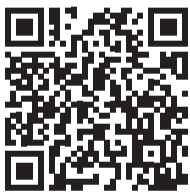
Video van 'Godmiljårdemiljeu'